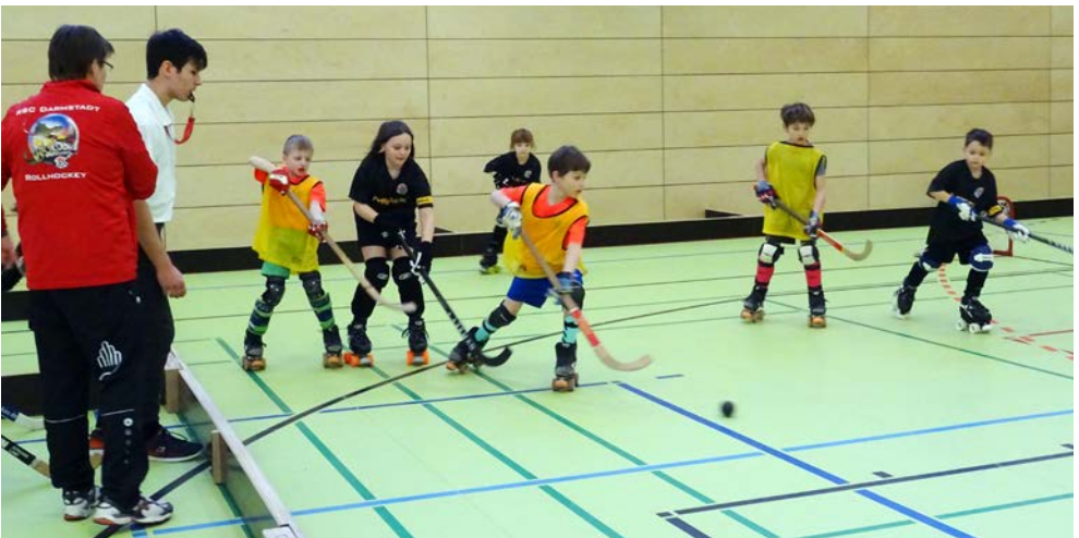
Unsere Rookies im Einsatz