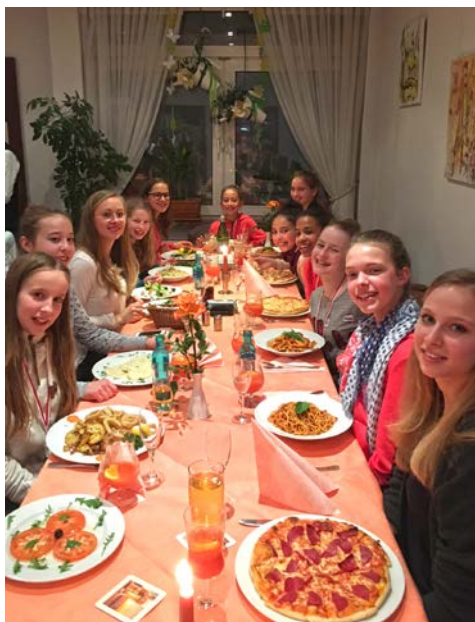
Siegesfeier bei leckerem Essen im Amato mit den Gymnastinnen, Eltern und ÜL