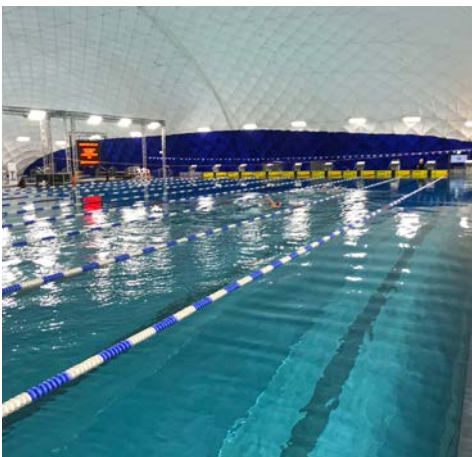
Morgenstimmung in der Traglufthalle